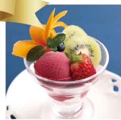
季節のソルベ ¥500 (税込)