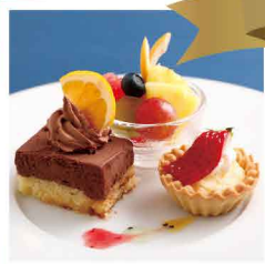
フレンチシェフが作るデザート ¥800 (税込)