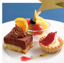
フレンチシェフが作るデザート